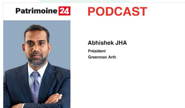
Podcast en partenariat avec Patrimoine 24