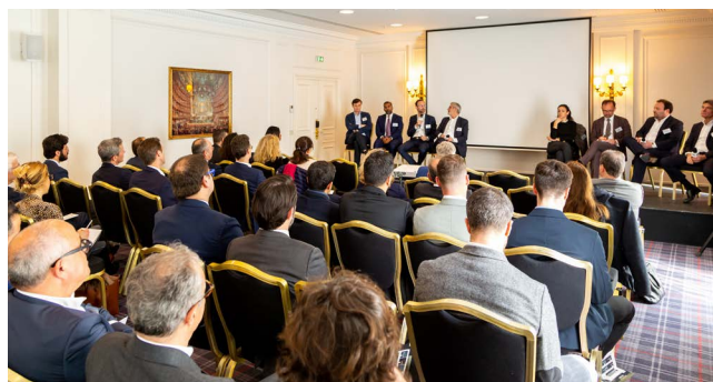
Intervention GRI France 2023