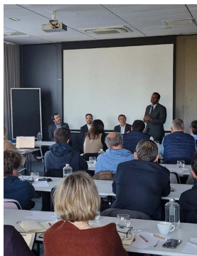
Partenariat et Road Show avec la Compagnie des CGP